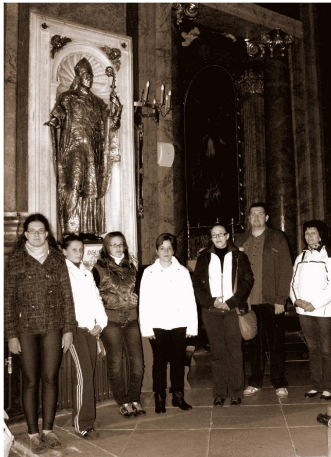
Névadónk, Ipolyi Arnold váradi püspök síremlékénél a nagyváradi Székesegyházban.

Ugyancsak Újkígyósi Keresztény Ifjúságért Alapítvánnyal közös program keretében október 9-én maroknyi újkígyósi fiatallal ellátogattunk a hagyományos feketetői vásárba, ami a Bihar hegység és Kalotaszeg egyik legjelentősebb hagyományos eseménye. Ezen az úton fölkerestük és megkoszorúztuk a nagyváradi Székesegyházban névadónk, Ipolyi Arnold tudós váradi püspök síremlékét.